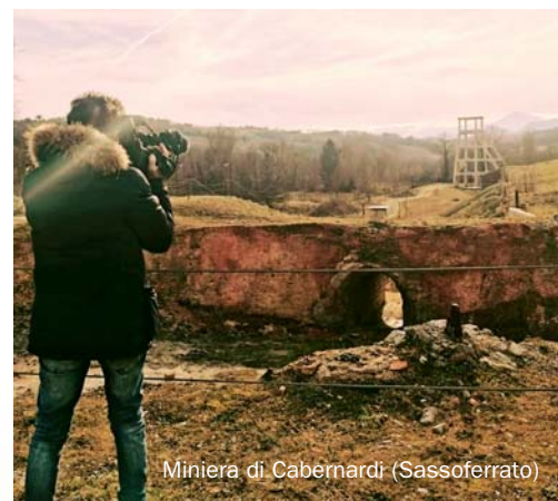
Miniera di Cabernardi (Sassoferrato)