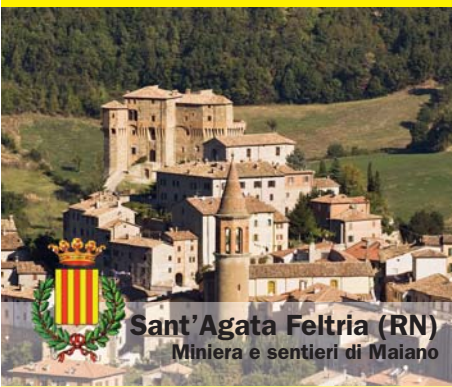
Sant'Agata Feltria (RN) Miniera e sentieri di Maiano