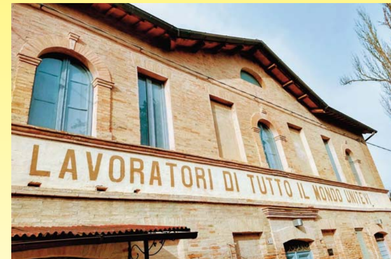
Casa del Minatore, Miniera di Urbino

Del patrimonio archeologico industriale sotterraneo e superficiale / Of the industrial-archaeological underground and surface heritage;