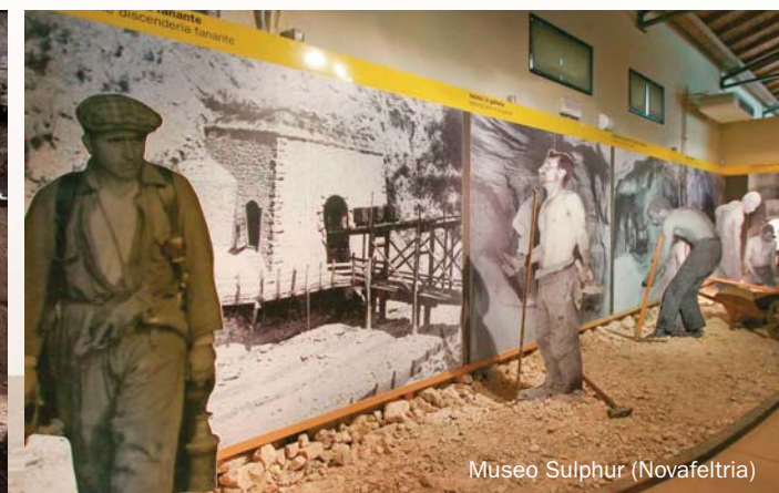
Museo Sulphur (Novafeltria)