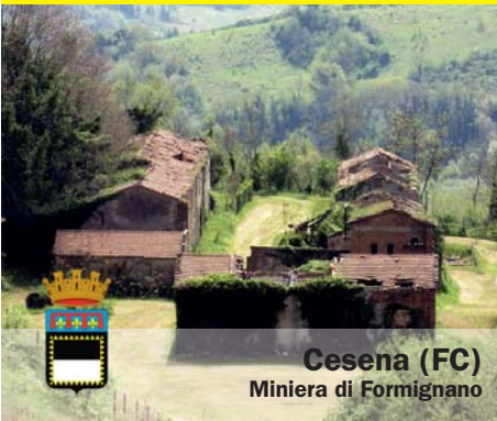
Cesena (FC) Miniera di Formignano