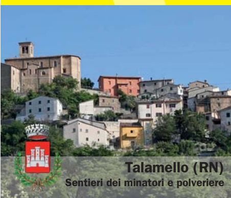
Talamello (RN) Sentieri dei minatori e polveriere