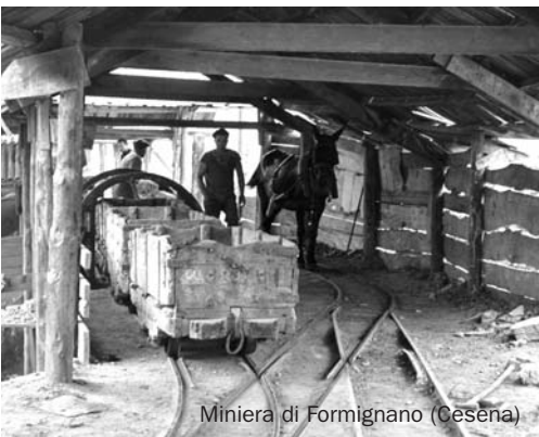
Miniera di Formignano (Cesena)

Governing Council , consisting of a President and 6 representatives of local authorities, Regions, Ministries of Ecological Transition and Culture and ISPRA; Park Community , made up of a representative from each member body of the Park Consortium; Board of Auditors .