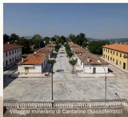
Villaggio minerario di Cantarino (Sassoferrato)