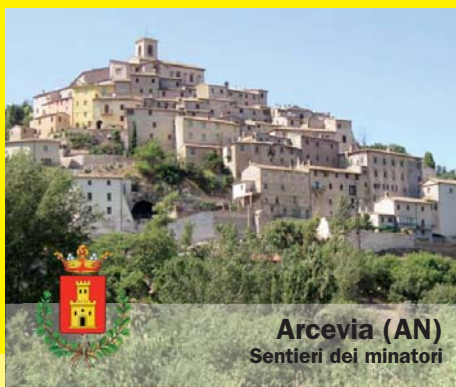
Arcevia (AN) Sentieri dei minatori