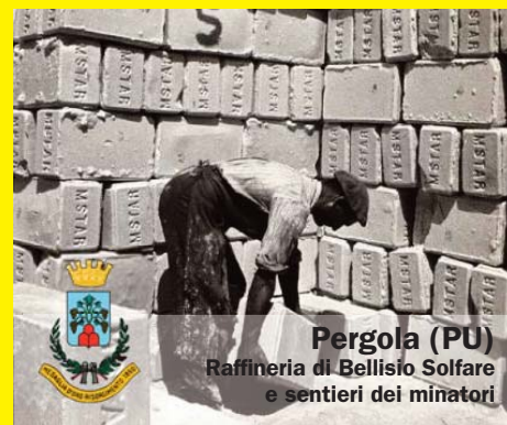
Pergola (PU) Raffineria di Bellisio Solfare e sentieri dei minatori