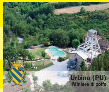
Urbino (PU) Miniere di zolfo

IL CONSORZIO DEL PARCO www.parcoszolfomarcheromagna.it