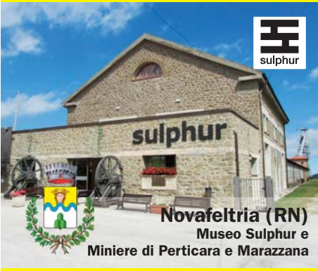
Novafeltria (RN) Museo Sulphur e Miniere di Perticara e Marazzana