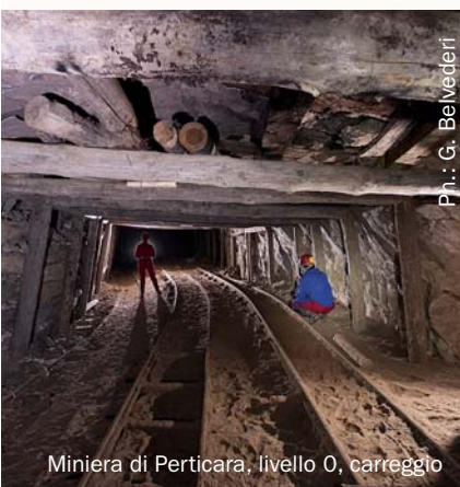
Miniera di Peticara, livello 0, carreggio