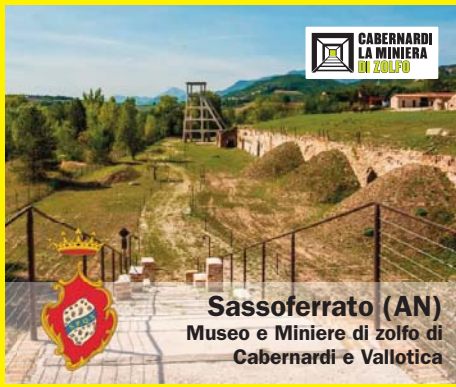
Sassoferrato (AN) Museo e Miniere di zolfo di Cabernardi e Vallotica